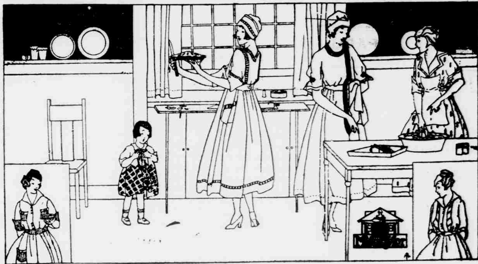
Připravovány na živých modelech.

John Dobry Mfg. Co. Cedar Rapids, U. S. A. Iowa.