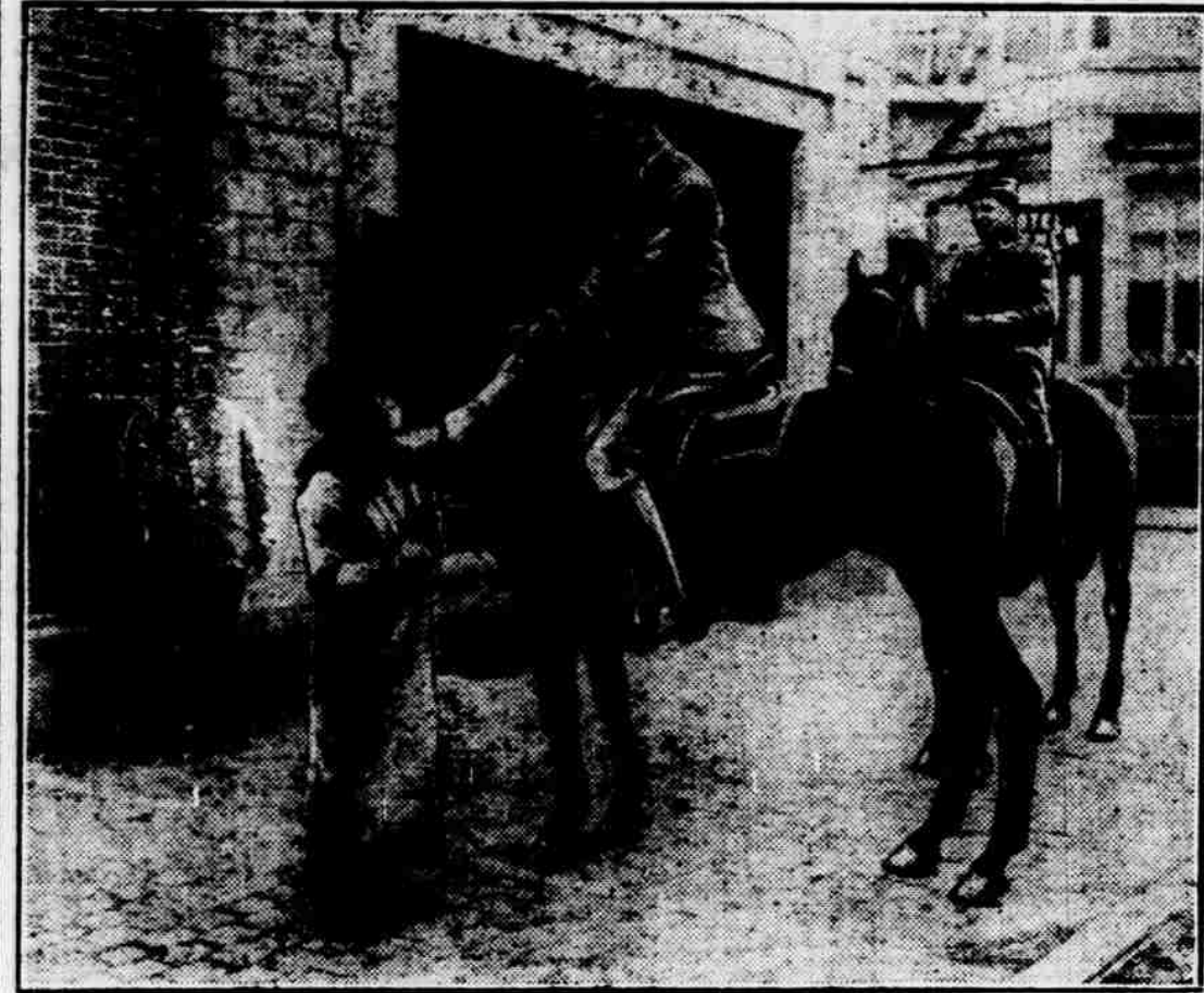
The German soldier loves his liquor, but drinks it in moderation. In this picture one of the Kaiser's cavalrymen, invading Belgium, is accepting a drink of wine at the hands of the fair foe.