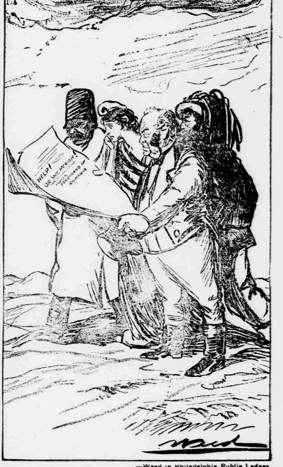
—Weed in Philadelphia Public Ledger.