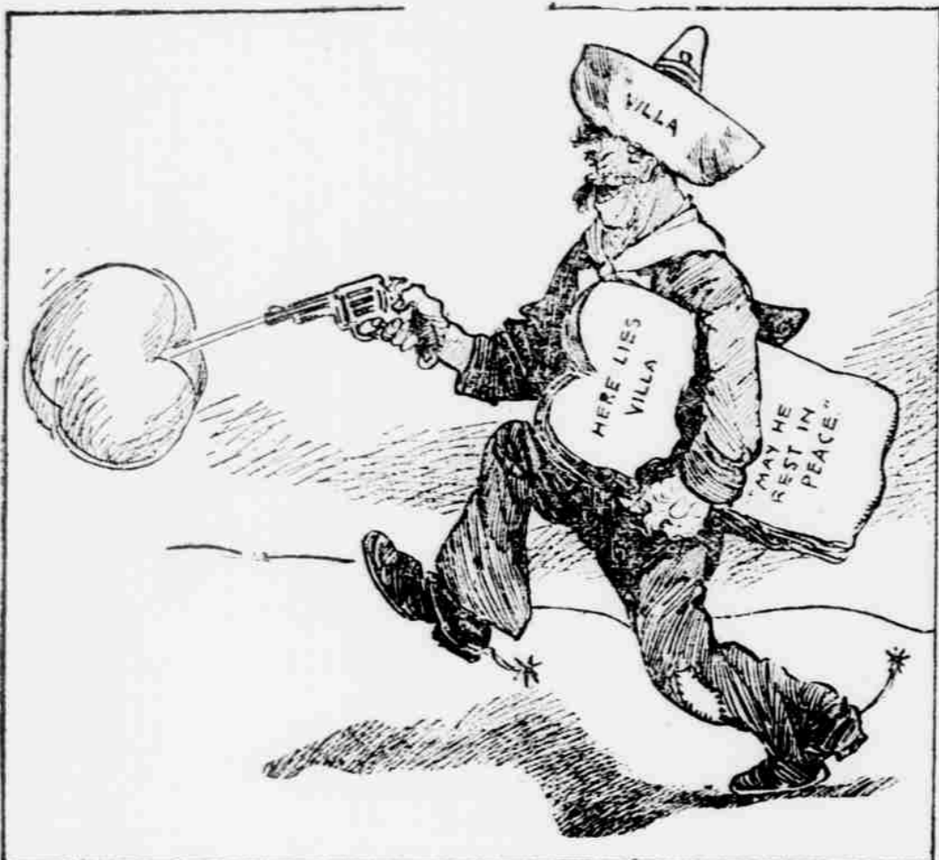
—Donahay in Cleveland Plain Dealer.