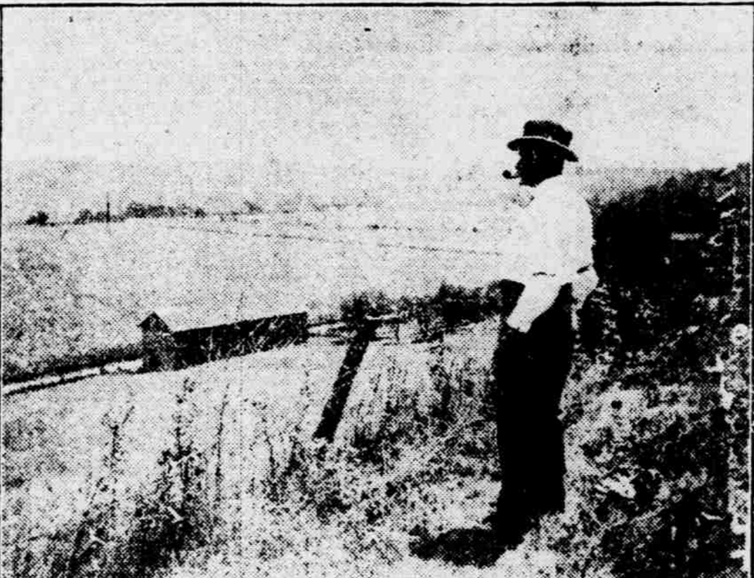
More than $13,000,000 is annually paid to the farmer by the liquor interests. Under national prohibition what would the farmer do with the grain that he now markets to the distiller? Would the Anti-Saloon League buy it?