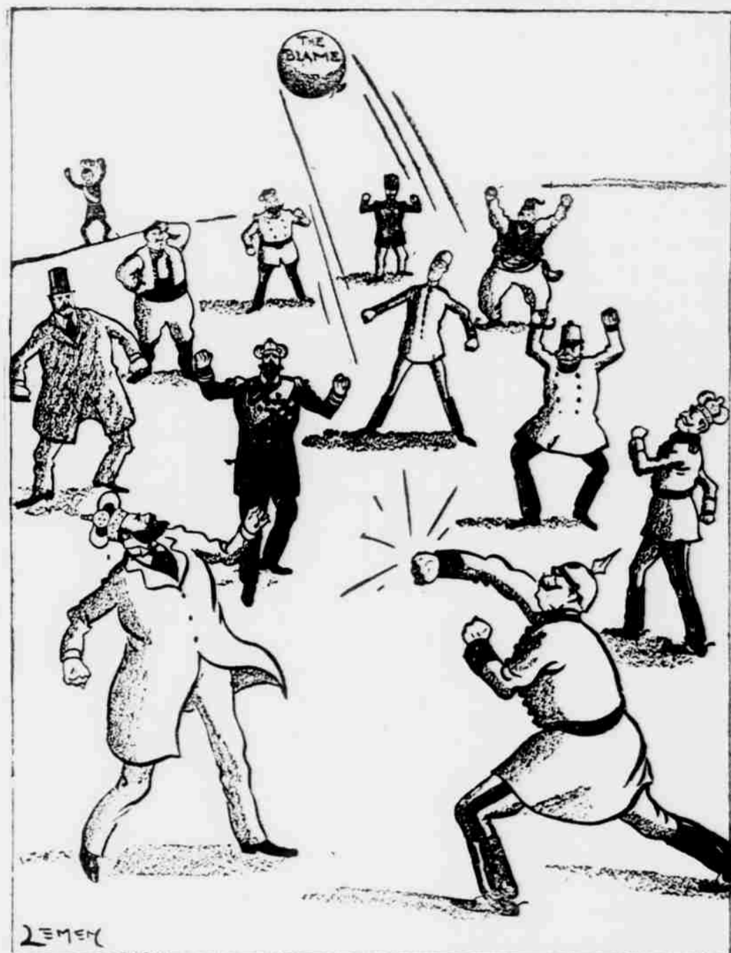
—Leitner in St. Louis Post-Dispatch.