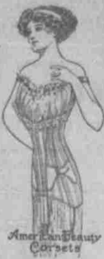
American Beauty Corsets

Zvláštní výklad krajkových záclon, pár $2 až $4.50 Látka na záclony, bílá a neblaná, yard 15c až 50c Stolní prádlo, yard.....50c až $1.50 Krajkové postelní pokrývky, každá $2.50 až $4.00 Nové krajkové výšivky a násběrky. 45pale. vyšívání voile násběrky, yard 95c až $1.95 45pal. vyšívání crepe násběrky, yd. $1.25 až $2.00 26pal. vyšívání swiss a crepe, dětské šaty a ná- sberky, yard.....50c až 95c 20paleové vyšívání crepe na šivutky, svl., yd. 95c Vyšívání pokrývky šněrovaček, yard 25c až 65c Zásilka dámského pleteného a mušelfnového prádla a šněrovaček American Beauty všech ve- likostí a druhů. Zveme vás ku prohlídce našeho skladu jarních a letních oblekových látek a ku porovnání cen a jakosti. Máme také na skladě Gownies zaručené pracovní rukavice, pár za $1.00. 47-1