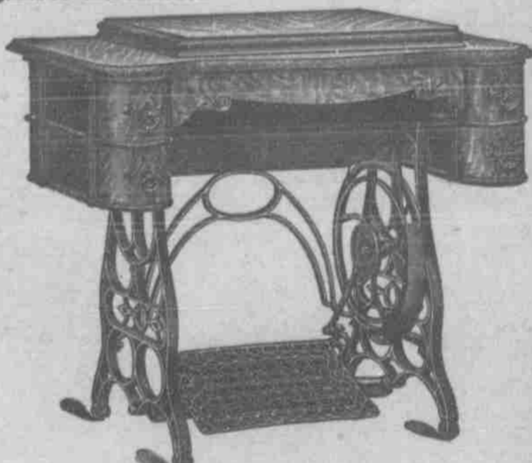
Drop-head Cabinet "Hospodář" čis. 24.

a opatřené kuličkovými lůžky, čímž zaručuje se nejlepší možný běh. Stroje "Hospodář" se spouštěcím ústrojím předčí úpravou a elegancí všechny jiné, jak viděti na vyobrazení. Naše stroje "Hospodář", mimo veskrzně své dokonalosti honosí se nyní ještě tím, že předek jest z ohýbaného dříví a to ne snad jen prostřední dlouhá zástávka, nýbrž i postranní zástávky, tak že se jiné obyčejné stroje tomuto v eleganci rovnati nemohou.