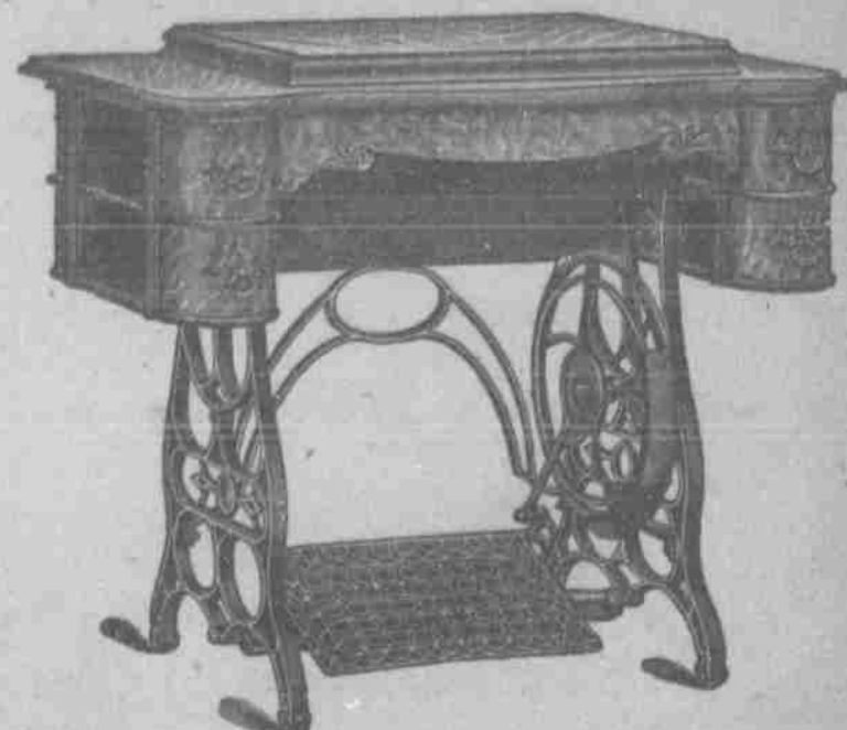
Drop-head Cabinet "Hospodář" č. 24.

a opatřené kuličkovými lůžky, čímž zaručuje se nejlhčí možný běh. Stroje "Hospodář" se spouštěcím ústrojím předčí úpravou a elegancí všechny jiné, jak viděti na vyobrazení. Naše stroje "Hospodář", mimo veskrzné své dokonalosti honosí se nyní ještě tím, že předek jest z obýbaného dříví a to ne snad jen prostřední dlouhá zásávka, nýbrž i postranní zásávky, tak že se jiné obyčejné stroje tomuto v eleganci rovnati nemohou.