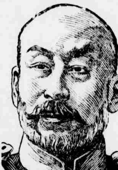
Admirál Togo, velitel japonského loďstva u Port Arthuru.