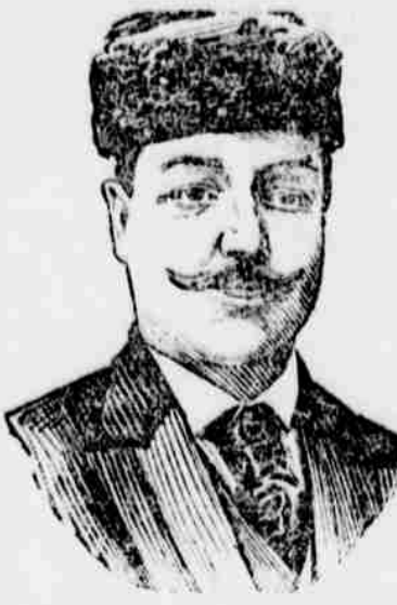
Hrabě Lamsdorf, ruský ministr zahraničních záležitostí.