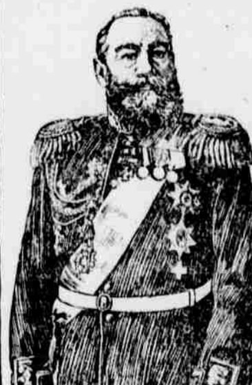
Mistokrál Alexeev, ruský vrchní velitel na souši i na moři.