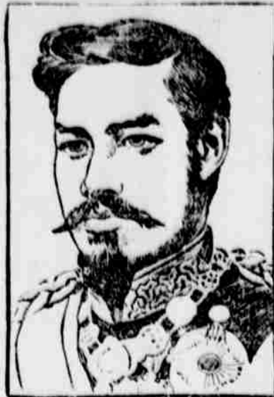
Japonský mikado (císar) Mutsuhito, (rozen roku 1852, vládné od r. 1868.)