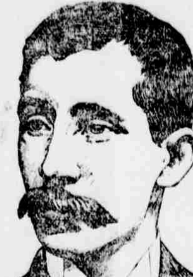
Baron Komura, japonský ministr zahraničních záležitostí.