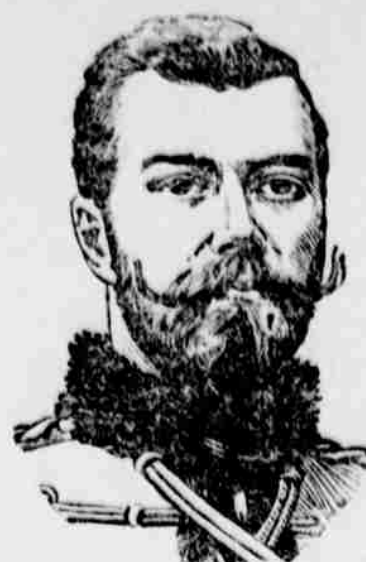
Ruský car Mikuláš II.