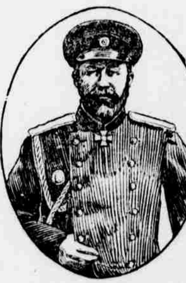
Gen. Kuropatkin, ruský ministr války.