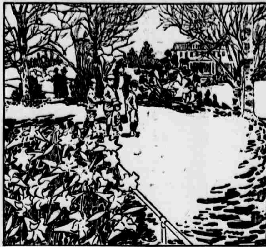
Najděte tři skryté lilie a kořk.