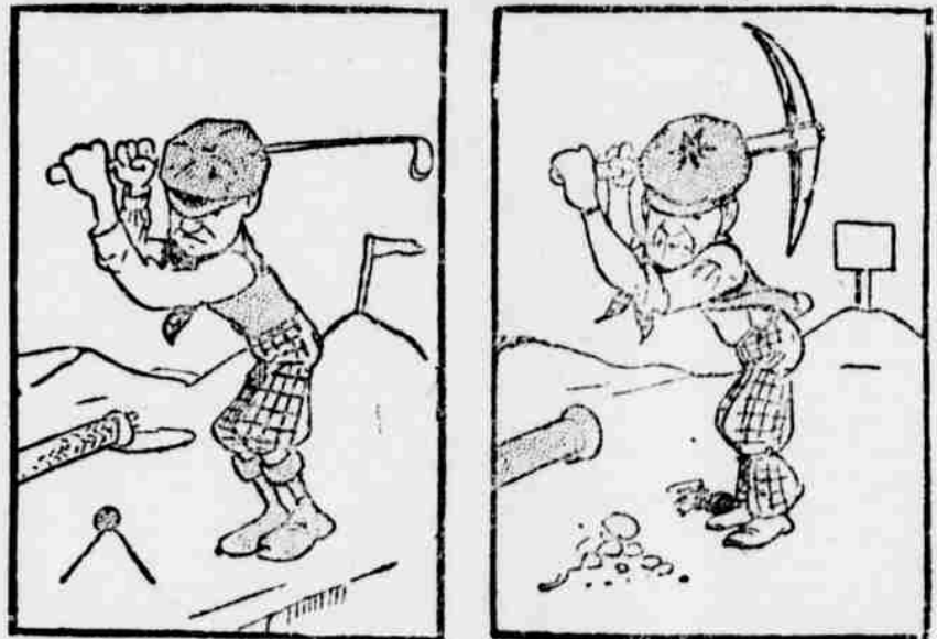
Lord Koasmetr v Anglii jen hrával golf — teď' v Americe tluče u cesty hromádky.