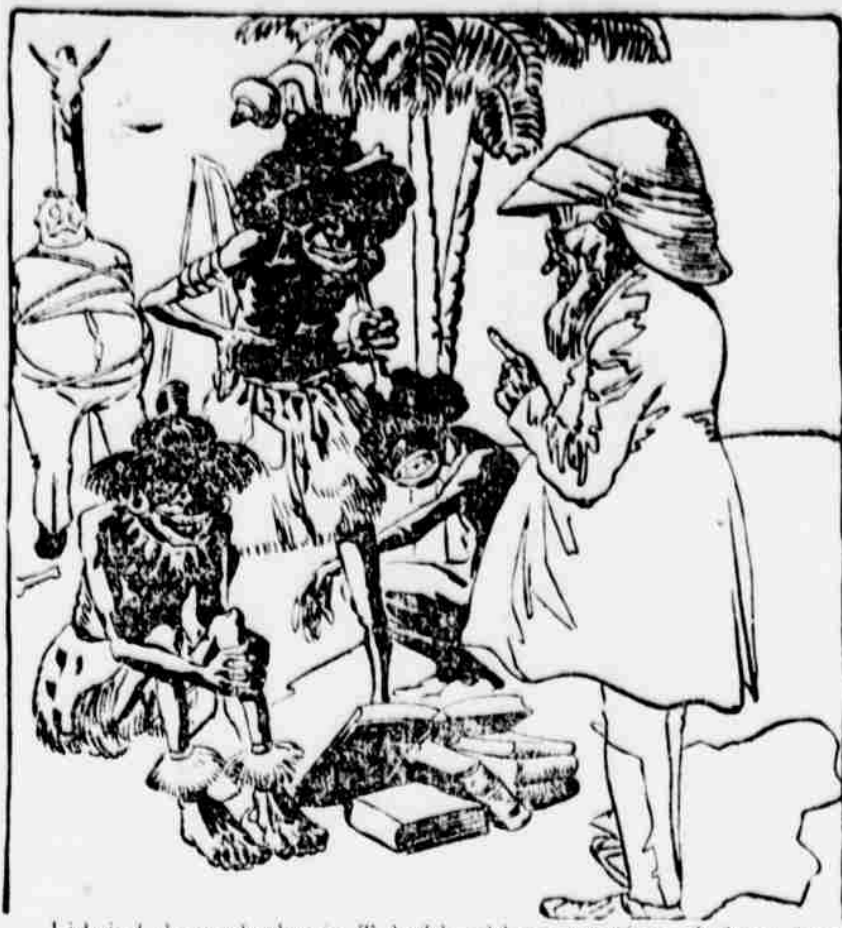
Lidojedík soudruhovi. Tohle chlapa pustíme. Jednou jsem už takového sněd a dolnes mám jeho brejle v žaludku!