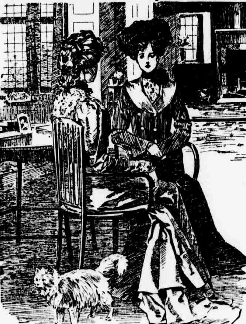
Helena: "Zdaž pak jsi slyšela, jaké věci o mně Emma, ta klepa, roznášá?" Adela: "O, nech jí! Já na tvém místě bych si jí nevsímla. Ona beztoho jen roznášá to, co povídají jiní."