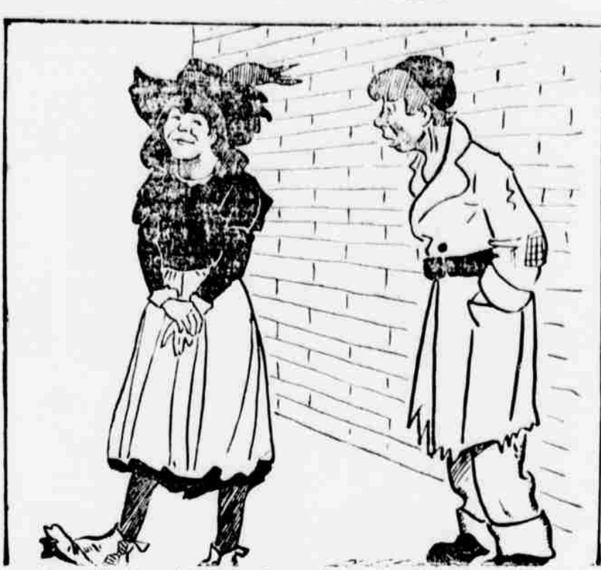
Ona: "Ty bys chtěl, abych s tebou šla do muzea za desak? Což nemáš pro mně patnáct centů na divadlo? Jdi si sam! Věkřá- tě nechci vidět!" On: "Však je dobře! Kdybyh si tě jednou vzal, ty bys u- beztoho přivedla na mizinu!"