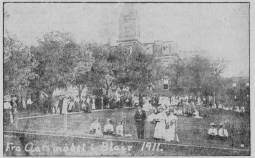
Fra Marsmodet i Blair 1911.

e o. Dana College, Blair, Nebr. Paa begge Billeder ses Stolen, Dana College og Trinitatis Seminarium. Det ene er taget saaledes, at en Høf af Marsmodets gæster ses i Fronten af Stolen; paa det andet ses Stolen bagfra samt det store Telt, hvori Marsmodet holdtes.