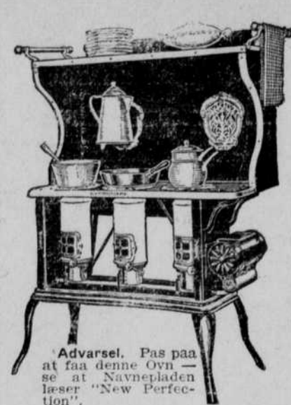
Advarsel. Pas paa at faa denne Ovn — se at Navnepladen læses „New Perfection“.

Den nye Rigsdags Sammentræden. Der er fra mange Sider bleven udtalt, at den nye Rigsdag ikke godt kunde samles, før Rigsrets-