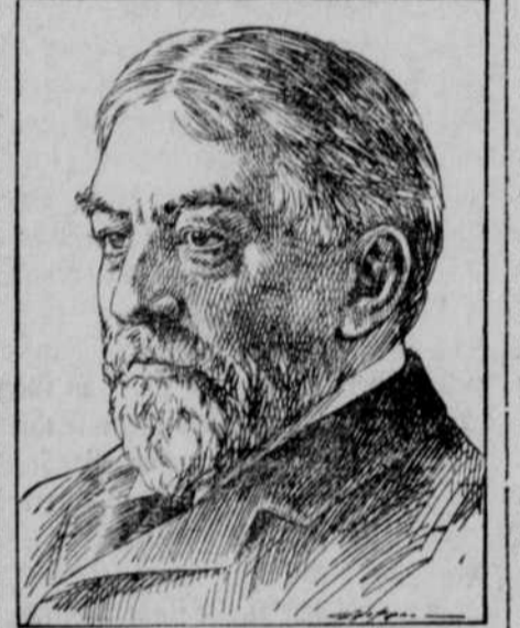
EUGENE HALE. United States Senator from Maine.

Utvivlsomt vil Aldrichs Afsted blive betragtet som et Nederlag for Højstolsbeskyttelsen. Han har i sin Person været et magtigt Volværf for dens Tilhængere. Hans uroflørlige Besidethed, grundet paa personlig Overbevisning, og den vældige personlige Indflydelse, han øvede paa Mennesker, gjorde ham til en af sin Tids mest formidrende Skikkelser, og i de 30 Aar, han har tjent i Senatet, har han sat sit Præg paa Landets Lovgivning.