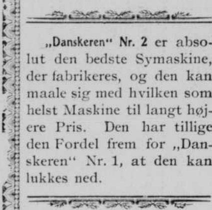
„Danskereu“ Nr. 2. Pris $18.75.

„Danskereu“ Nr. 1 er i alle Maader en god, solid og billig Symaskine. Den syer hurtigt og uden Støj, har 4 Skuffer og er af nyeste Konstruktion. Der gives 10 Aars Garanti paa Maskinen. Enhver Køber vil blive fuldt tilfreds med en saadan Symaskine, og skulde den ikke være tilfredsstillende, kan den tilbagesendes.