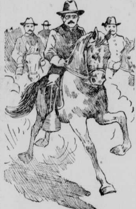
ROOSEVELT LEADING HIS ROUGH RIDERS.

West Dyster Bay i New York ejer han sit „homestead, et smukt men ikke lukfurist Hjem, paa Toppen af Sagamore Hill. Roosevelts er gift for anden Gang. Med sin første Hustru har han den smukke Datter Alice. Hans nuværende Hustru, født Edith Carow er meget intelligent, en ivrig Læser, ligesom ham selv, og fuldt optagen af sin Mand's politiske Liv og Zøer. Men hun er fremfor alt sine 5 Børns sømme Moder. Derfor har hun ikke deltaget videre i Selskabslivet. Hun har fra Barn været sin Mand's og dennes Søstendes Vegetarmerat, men da han blev gift med Miss Lee fra Boston, var hun rejst til Europa. Ser trof Roosevelts hende efter at hans første Kone var død. I Washington har de været kendt for, at de ikke ønsker formelt Selskabelighed. De holder hellere aabent Hus.