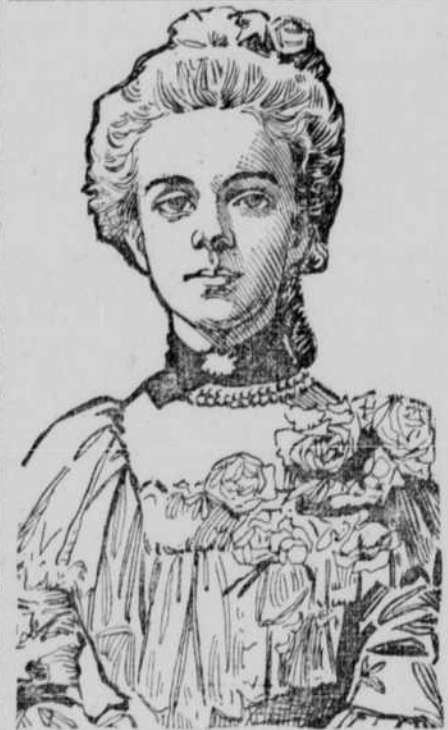
MISS ALICE ROOSEVELT, (President's eldest daughter.)