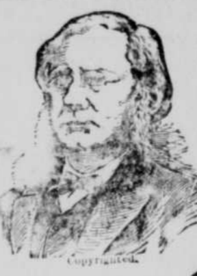
Copy from [illegible]