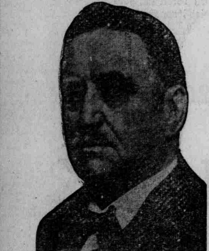
Der Lebenslauf eines erfolgreichen Mannes.

Die Freundschaft begeh zwischen Dummheiten, die Liebe oft—der Hah immer.