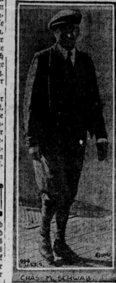
Charles M. Schwab, der Stahlkönig, auf dem Golfplatz. Er freut sich des Lebens, so lange noch das Eisen glüht.

Atchinson, Kas.—Der 21jährige Cherry Flynn und der 18jährige Frank Weston von hier, welche sich an zwei junge Mädchen von 14 resp. 16 Jahren, die aus dem staatlichen Botsenhaus entwichen waren, terminal vergangen hatten, wurden zu einer Zuchthausstrafe von nicht mehr