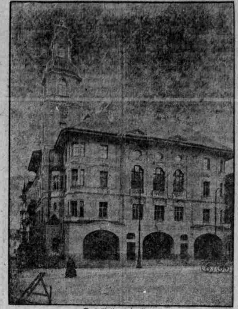
Das Diethaus in Bozen.

Sehr hart wirt natürlich die neue Staatsangehörigkeit Bozens auf die wirtschaftlichen Verhältnisse ein. Ob Bozen als Handelsplatz einem neuen Aufschwung oder dem Verfall entgegengeht, darüber sind die Meinungen hier noch geteilt.