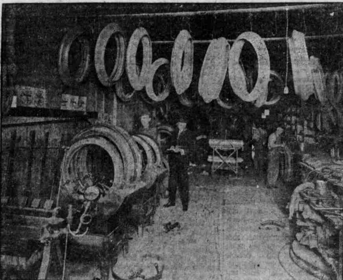
Wo wir gegenwärtig tätig sind