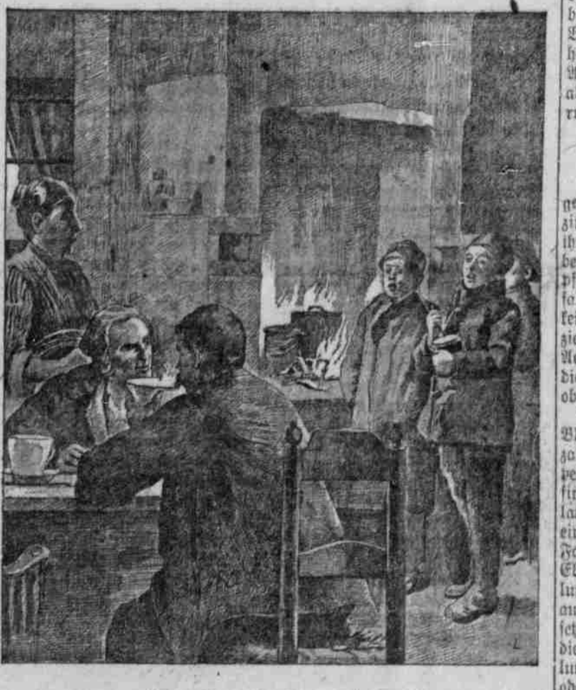
Neujahrssänger in Schwabmünchen.

Wir hoffen — — — auf was? Wir können es nicht sagen. Doch es anders wird. Doch es besser wird.