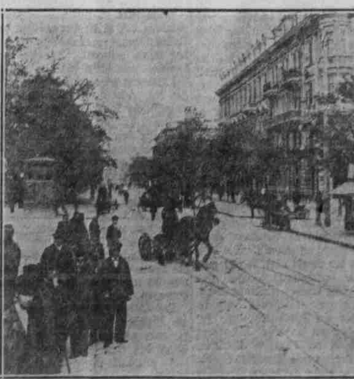
Die Nischen-Straße in Odessa.