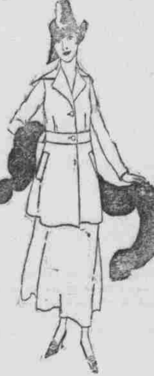
Burgess-Nash Co.—Down Stairs Store.

Saty Plüschmäntel, ganz gefüttert, großer Cape Kragen, gefächelt und mit Krante garniert. Ganz gefüttert und mit losem Hüden, vorne gegürtelt. Besondere Spezialität für Freitag, für $9.95.