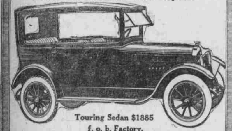
Touring Sedan $1885 f. o. b. Factory.

Weniger auf einem erschlossenen, 40 HP Vette Gerüst mit seinem Real Continental Motor, Zinsen Wägen und Angestellten, Scheiben Licht und langen, 40 elektrischen untergeordneten Einrichtungen. Dies ist eine Car, die in Bezug auf Schönheit, Wirtschaftlichkeit und abfahrschnelles Komfort vollständig in dieser Preislage unübertroffen ist.