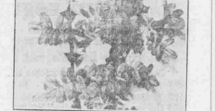
Die seidenhaarige Rose (Rosa sericea.)

Die seidenhaarige Rose, Rosa sericea, ist eine sehr schöne Art, die im Sommer blüht.