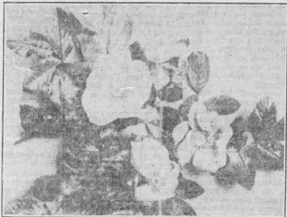
Die tarantinische Rose (Rosa carolina.)

Am den Ufern des Missouri wächst die Rosa blanda, in den Mooren Rosa carolina und Rosa sericea.