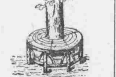
Runde Bank an einem Baumstamm.

Die Anlage einer runden Bank an einem Baum aus Naturholz wirden wie so auszuführen, wie sie aus beifolgender Abbildung ersichtlich ist.