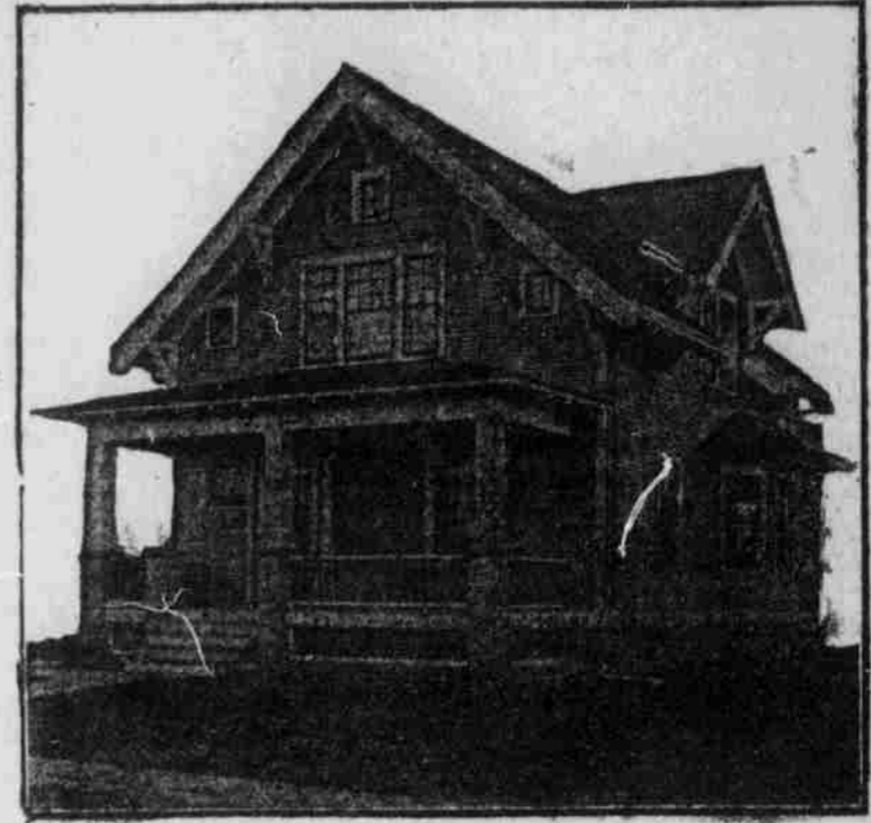
Respektiv-Ansicht — nach einer Photographie.