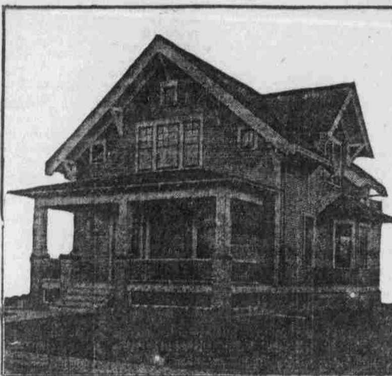
Perspektiv-Ansicht — nach einer Photographie.