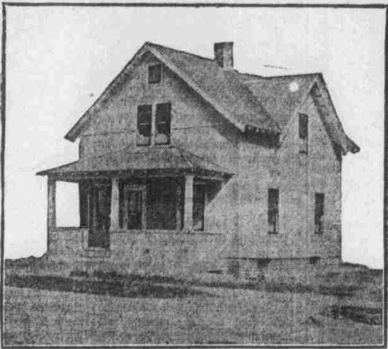
Perspektiv-Ansicht — nach einer Photographie.