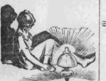
„Hierin enthalten sind zwei Tropfen „Gee-N“ ein einziges Glas.“

„Ich tröpfelte gestern Abend zwei Tropfen „Gee-N“ darauf — jetzt ansehe!“