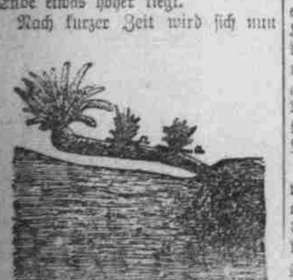
Die Seitentriebe wirken nicht an der Hauptwurzel.

Man macht nun an den Pflanzstellen in den Reihen mit einem etwas gebogenen Pflanzenholz schräge Fächer so lang und so tief in den Boden, daß der Fischer gut hineinragt.