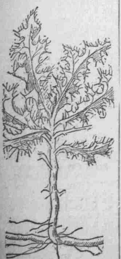
Blätter und oberer Teil des Wurzelstoc.