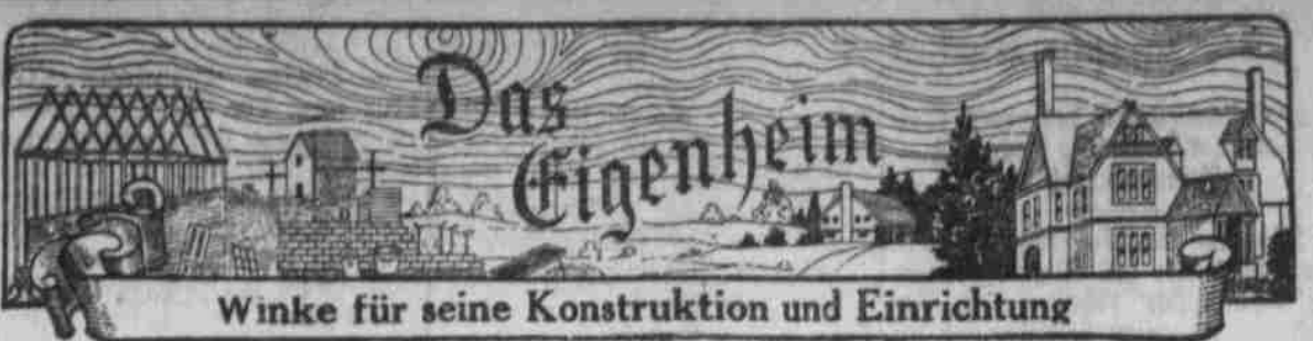
Winke für seine Konstruktion und Einrichtung