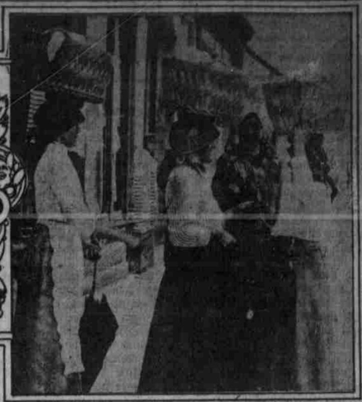
Strasfengasse in Würz. Wäflerinnen im eisigen Weisrad.