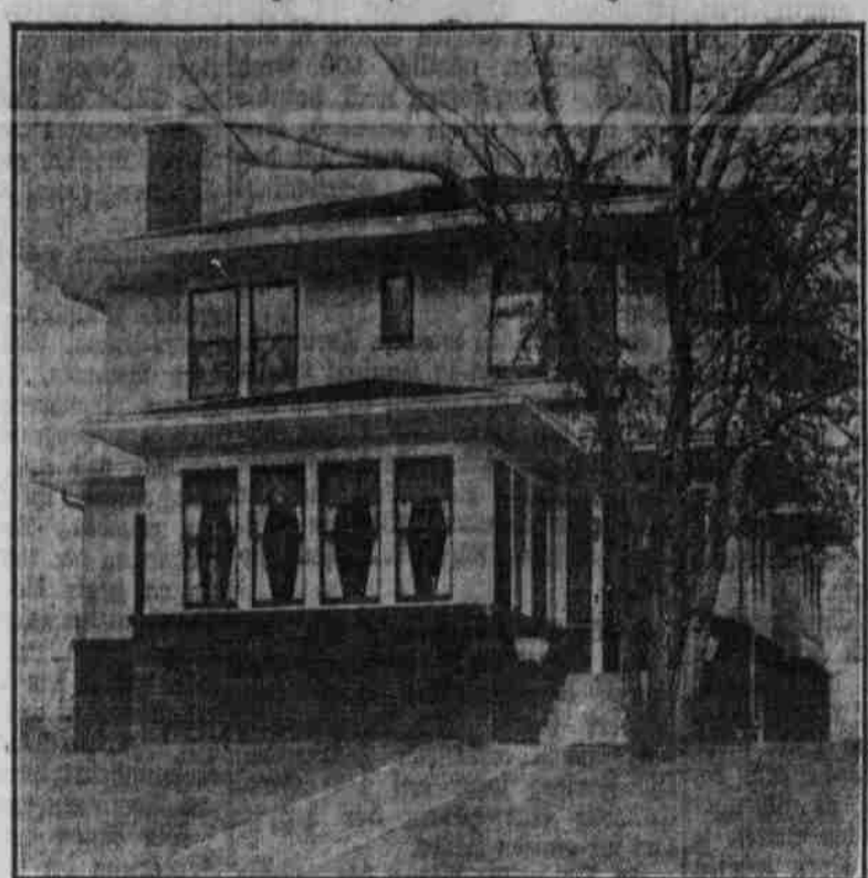
Perspektiv-Ansicht - nach einer Photographie.