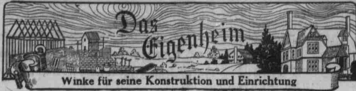
Winke für seine Konstruktion und Einrichtung