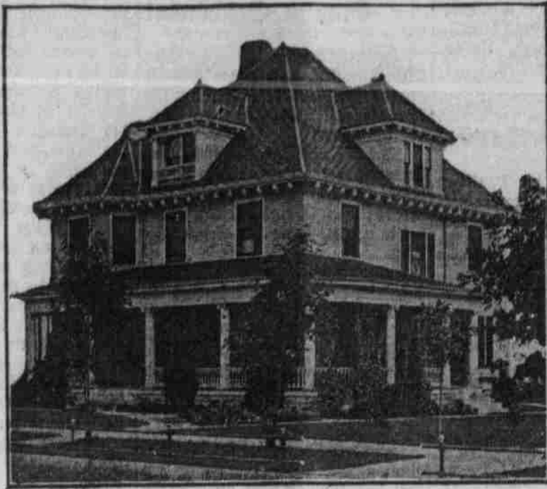
Perspektivansicht, nach einer Photographie.