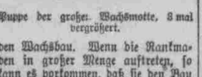
Puppe der großen Wachsmotte, 3 mal vergrößert.