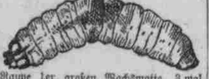
Wachsmotte, 3 mal vergrößert.