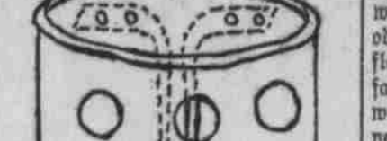
Näheapparat, aus einer Blechschachtel gefertigt, geöffnet.

Beide Arten finden sich wohl das ganze Jahr hindurch, am zahlreichsten im Sommer.