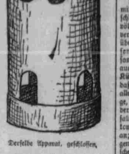
Derselbe Apparat, geschlossen.

Ein besonderer Zweig der nützlichsten Milchverföhrung in Kopenhagen und anderen nordischen Städten, in der dort heute noch das Vollkommenste geübt wird, ist die ärztliche Kontrolle der Behandlung der Kindermilch.