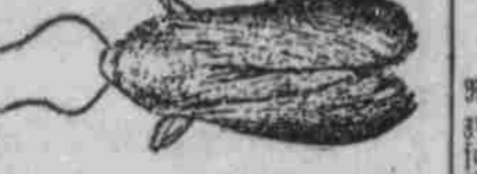
Große Wachsmotte, 2 1/2 mal vergrößert.