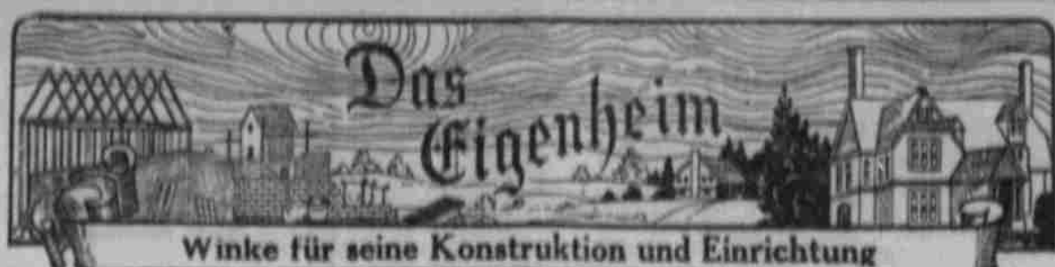
Schönes Haus fürs Dorf.

638 und 640 Keeline Gebäude. Telephon Douglas 5252.