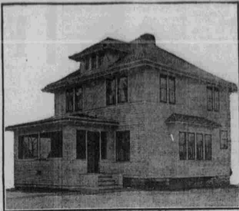
Perspektivansicht, nach einer Photographie.