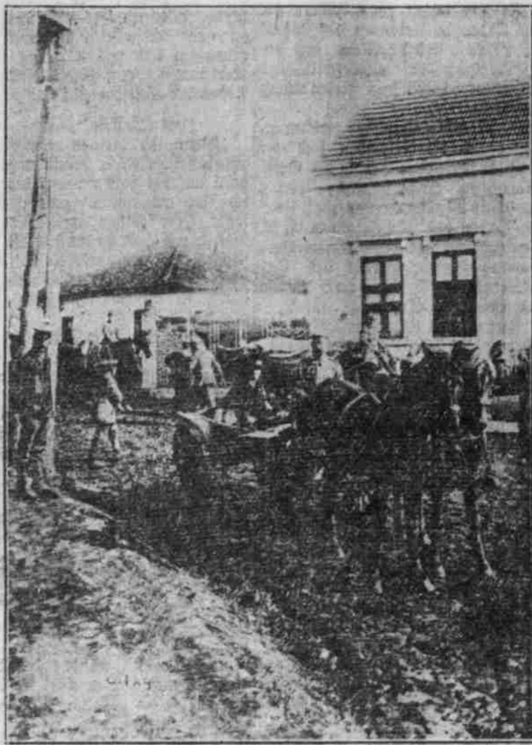
In Kapovo, Serbien: Heim legen der Trübe von Berlin nach Konstantinapel.