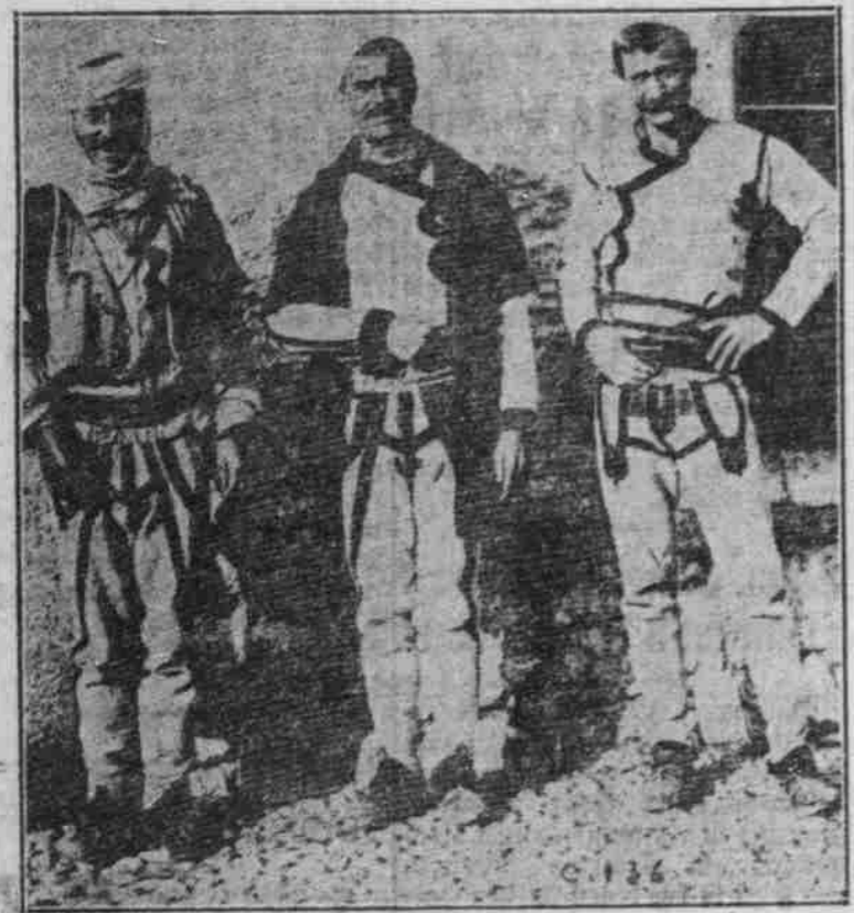
Typen aus Serbien, Albanien und Montenegro.

Berühmtes Schloss. Der Berliner „Bund“ berichtet: Nachträglich erfährt man, daß das in Hixabach südlich von Altitzsch befindliche, dem Baron von Reimach (Paris) gehörige prächtige Schloss mit samt den dazu gehörigen Detonationsgebäuden am vergangenen Freitag durch französische Fliegerbomben vollständig zerstört worden ist. Es ist den deutschen Soldaten, welche zur Rettung der Gebäulichkeiten herbeigekommen waren, nicht mehr gelungen, das Feuer zu dämpfen und das wertvolle Inventar nebst den reichen Kunstschätzen des Schlosses zu retten.