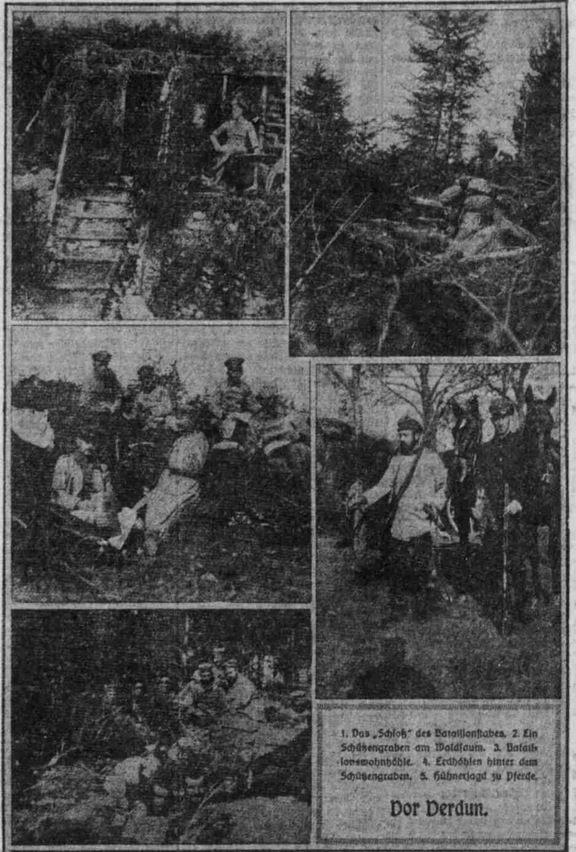
1. Das „Schloß“ des Battalionshabes. 2. Ein Schützengraben am Woldsum. 3. Bataillonswohnhöhle. 4. Erdhöhlen hinter dem Schützengraben. 5. Fahnenjagd zu Pferde.