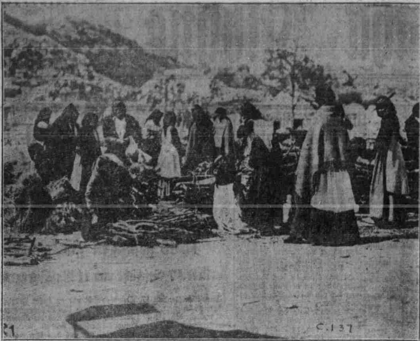
Solmarkt bei Cetinje, von Frauen geleitet.