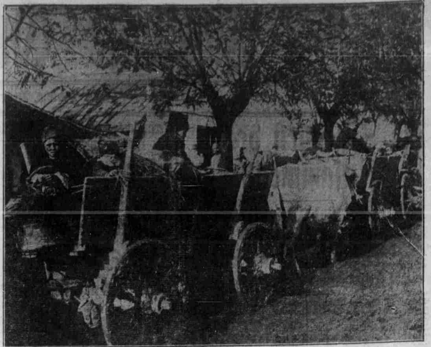
Serbische Typen vom Morava-Distrikt: Flüchtlinge auf der Rückkehr nach ihrem Heim.