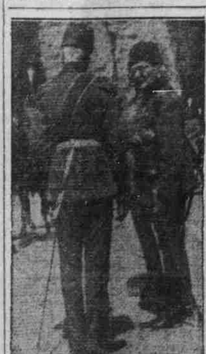
Der Oberbefehlshaber der Armee (General) Enver Bey, v. der Galt in Mesopotamien.