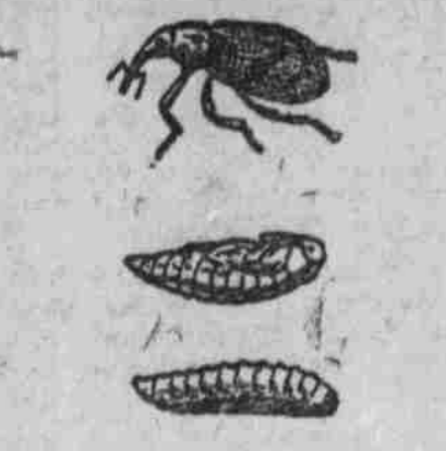
Der Apfelblütenstecher: Käfer, Puppe und Larve.