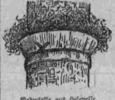
Madenfalle aus Holzwohle.