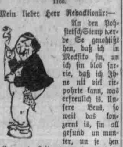
Mein lieber Herr Redaktionsrath.