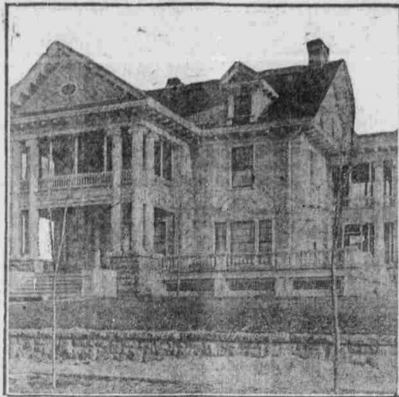
Perspektivanicht nach einer Photographie.