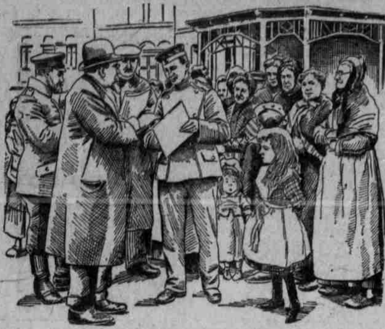
Kontrolle der in einem Städtchen der Champagne zurückgelassenen französischen Einwohnern.