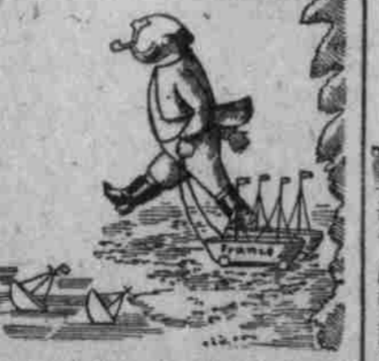
Als der John nach Süden zog, In ein leichtes Luftschiff trat...