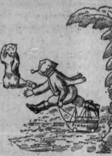
Den da war nicht viel zu sehn, Schiffe nur, die untergehn!