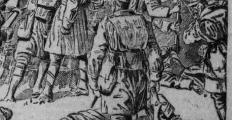
Dasmatinische Infanterie erwartet in einem Schützengraben an der Nonzo-Front...