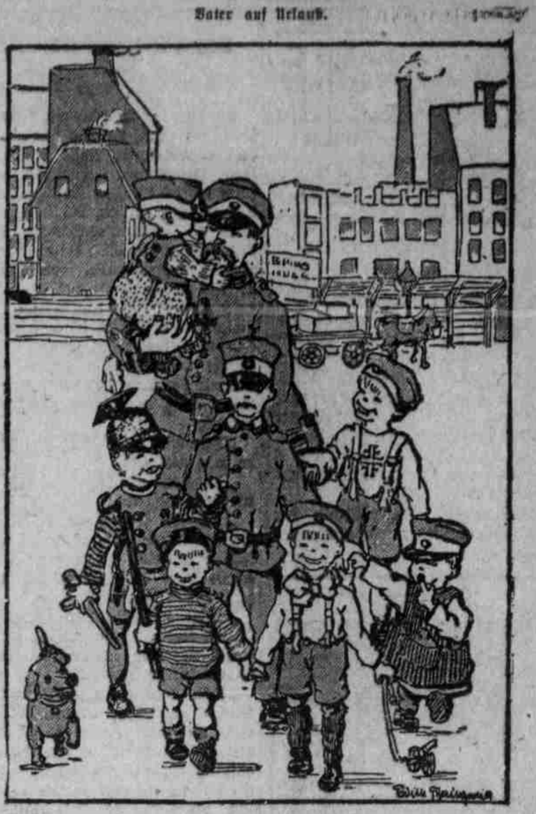
Der Söhne — sieben! Sei, das ist sein Stolz! Doch erst die Zukunft bringt das Mädchen!