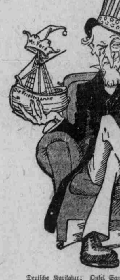
Deutsche Karikatur: Uncle Sams ironisches und naßes Auge.