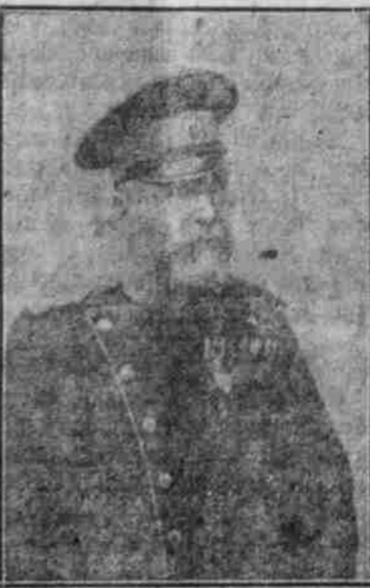
Vukobrat Vukitch, der serbische Oberbefehlshaber.