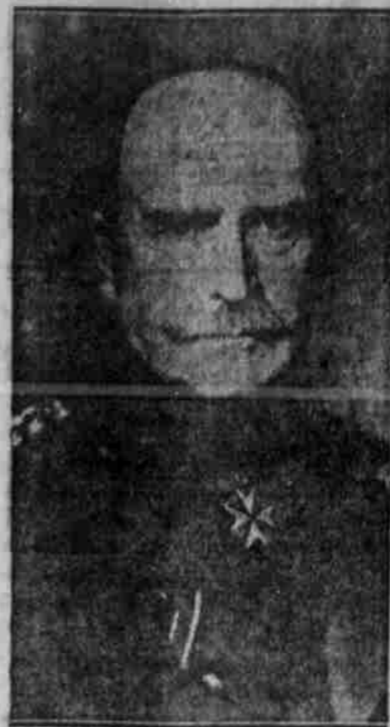
General v. Befeler, der Eroberer von Novo-Georgiewsk.