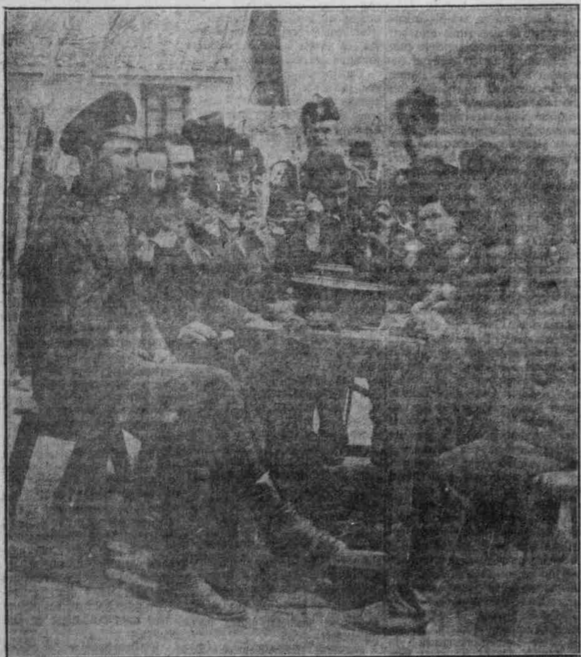
Bei der bulgarischen Armee in Serbien: Wiltingskraft in einem eroberten Dorf.