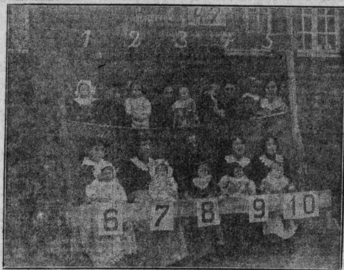
Massenaufnahme französischer Frauen in einem Grenzort. Die Bilder werden den Häften der Eingeborenen ausgeteilt.