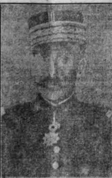
General Dubail, Oberbefehlshaber der Südfront.