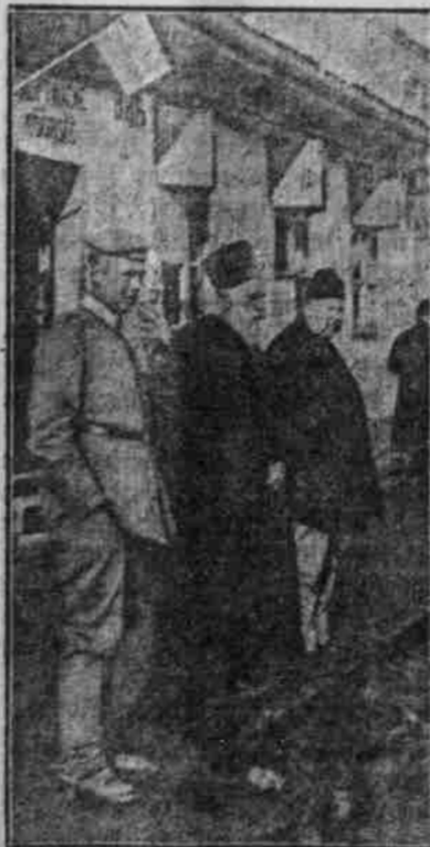
Feldgrauer mit einem serbischen Geistlichen und seinem serbischen Wirte.