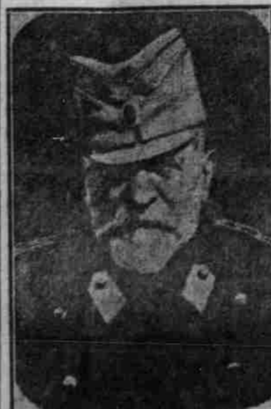
Der geflohene serbische Generalissimus Pajic.