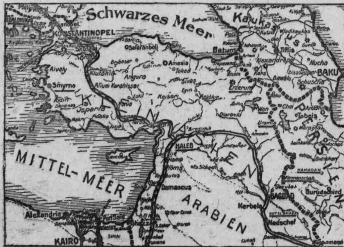
Die Fronten von Saloniki bis Persien.