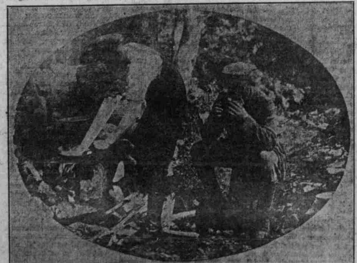
Beobachtungsposten auf einer einsamen Vogelshöhe bereitet sich seine Mahlzeit. Es gibt Pfannkuchen mit Marmelade; beim Baden dient eine Säge als Kuchentender.