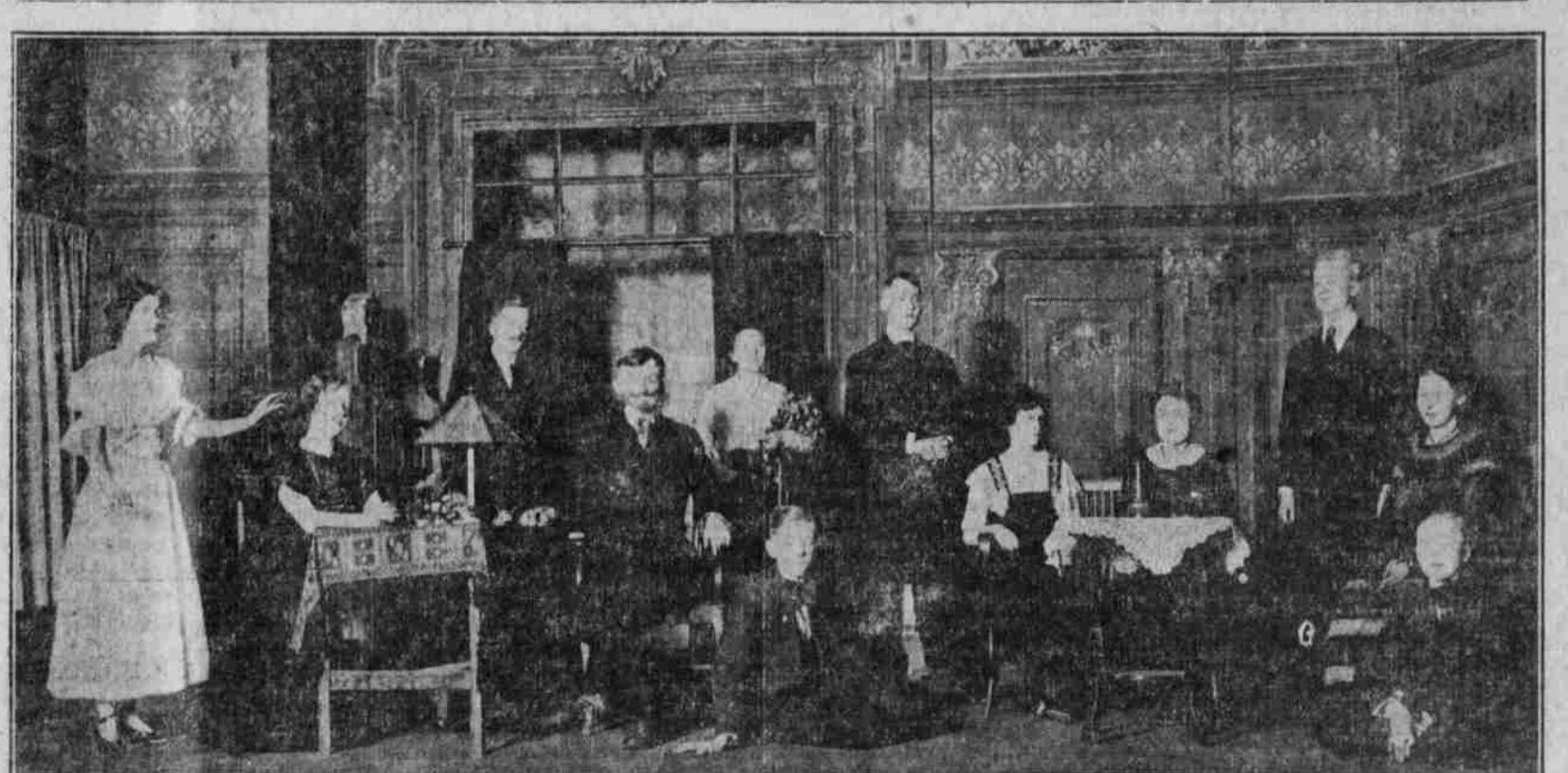
Szene aus „Das Glück im Winkel“, dargestellt vom Deutschen Dramatischen Klub der Universität von Nebraska, am Montag, den 14. Februar, im Musikheim.