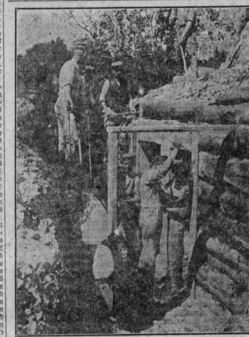
Die mühseligen Unterstände der Deutschen.

Wir waren einmal, der Obergeneralarzt der ... ten Armee, der Generalarzt und ich im Auto fuhren mehr als einmal von Posen angehalten worden.