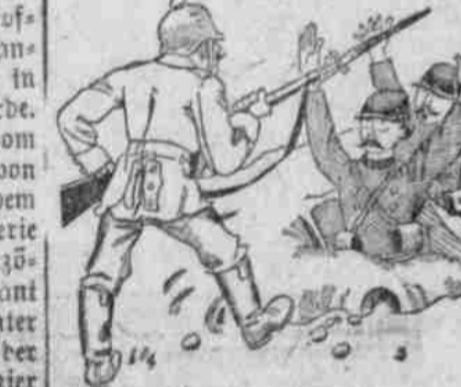
Vater nimmt die Schützengräben ein und Mutter nimmt die Grobchen ein.