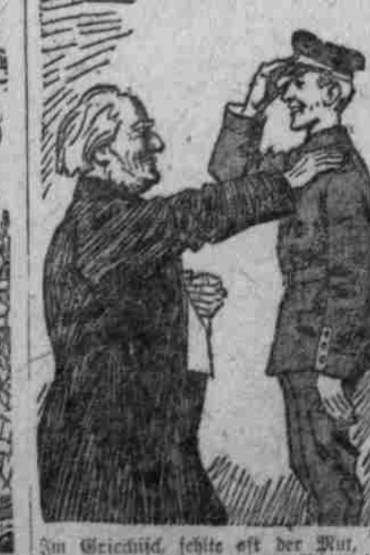
In Gleichheit, welche oft der Mut, auch hundert's beim Herzog-Gebietel.

Der Ordinarius an den mit dem Eisernen Kreuz erster Klasse geschmückten Bräutigam.