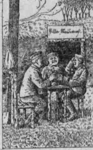
Abends nach dem Zubettgehen wird der Wagen erst geputzt, und zur Verdaulichkeit ein Dauerlat geputzt.