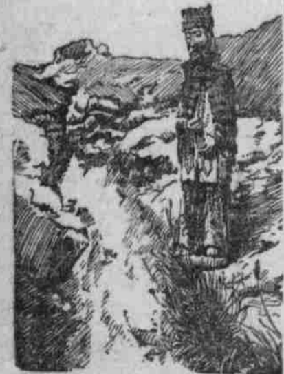
Deutsche Truppen finden solche Heiligengräber, die nach dem Glauben der russischen Soldaten den russischen Waffen zum Siege verhelfen sollen.

Hier gründeten 1875 der Methodo Proklowitsch und der Pape Miletia Simonowitsch eine Anzahl Streifkorps.