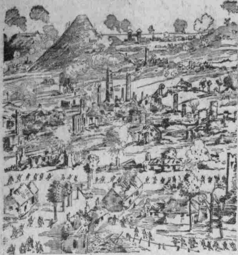
Der Kampf von Loos in englischer Darstellung.