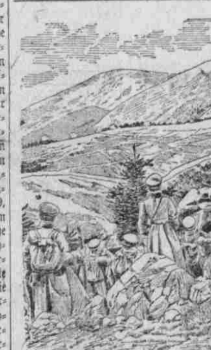
In Abwehr eines serbischen Ueberfalls nehmen Truppen der ersten bulgarischen Armee Positionen an der serbischen Grenze.

Der Juwelier erklärte, die Brosche sei aus solchem Golde, er könne nur 15 Lire dafür zahlen.