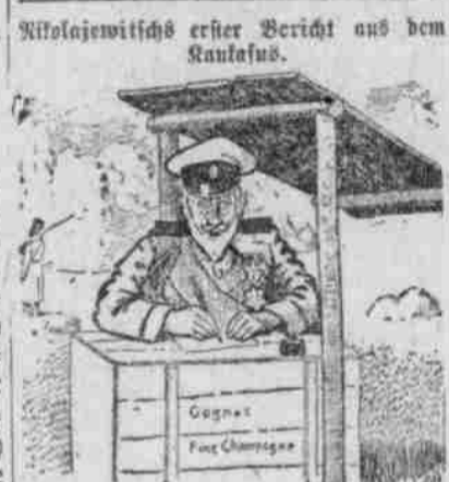
Vielmehr! Habe mich gut eingelebt. Welche gar keinen Unterschied.

Emma Gramatica hatte dies damals unter Vorwissen in italienischen Blättern verkünden lassen.