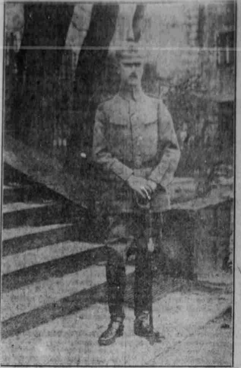
Herzog Carl Eduard von Sachsen-Coburg-Gotha.