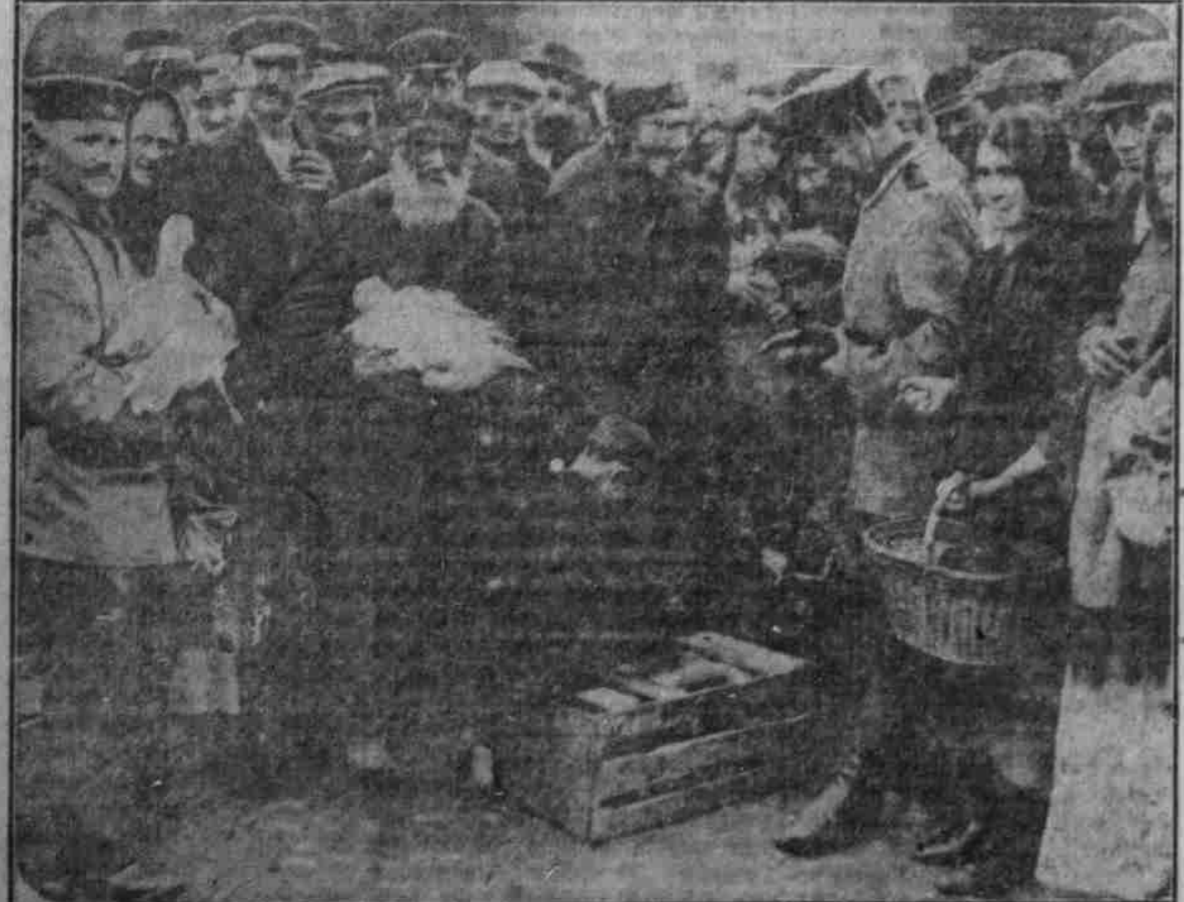
Geldgraue Küche als Einkäufer auf dem Geflügelmarkt einer Stadt Russisch-Polen

Paulus Bros für Frankreich Gefangene. Die Gefangenen in Frankreich erhalten eine besondere Art von Dauerbrot; es wird aber von gewissenlosen Spekulanten nach der „Bataille Syndicaliste“ vom 13. Juli in einem so harten und so verfaulenden Zustand geliefert, daß es ungenießbar ist. Vielfach haben sich die Gefangenen darüber beklagt. — Die Zeitung erhofft Abhilfe von der Erfindung eines neuen Dauerbrotes, das sich 4 bis 6 Wochen haltbar halten soll.