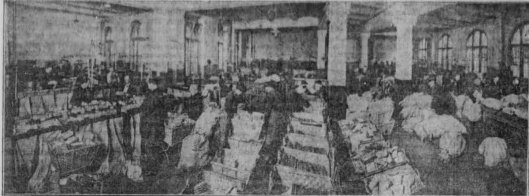
Der Hauptsaal der Feldpostsammlung in Berlin: Die Feldpostfächer werden verpackfertig gemacht.