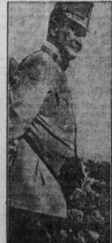
Feldmarschall-Leutn. Gisinger, der Führer einer starken österreichisch-ung. Armeegruppe, die gegen Italien kämpft.