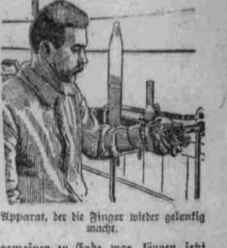
Apparat, der die Finger wieder gelenkig macht.

Cholm... Die vor einiger Zeit von den Ukrainern... Cholm... Der Krieg der Kleinen.