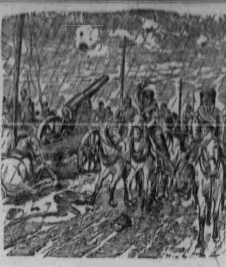
„Gindenburg kommt“ — Deutsche Kritik auf der Front.

Im Hinblick auf die Ereignisse des 1. Sept. 1914... Ein Aufruf an die Deutschen von Nebraska... Die deutsche Presse in Nebraska wird freundlichst gebeten, diesen Aufruf zum Ausdruck zu bringen.