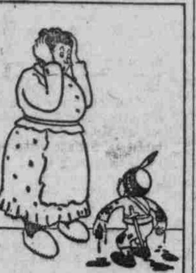
„Junge, wie sieht Du denn wieder aus! Du bist bei den Ohren nehmern, Bengel! Wo hast Du Dich denn eigentlich so zugezogen? Das ist ja zu toll!“

Die vor einiger Zeit von den Ukrainern... Cholm... Der Krieg der Kleinen.