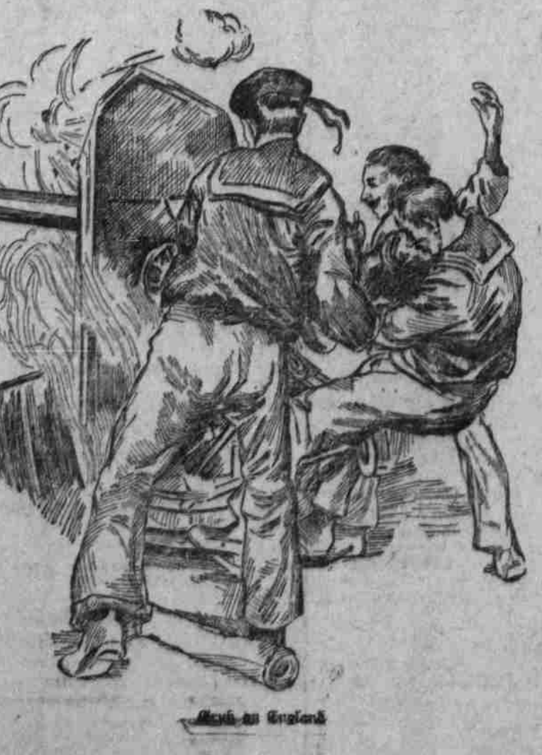
Wahl in England