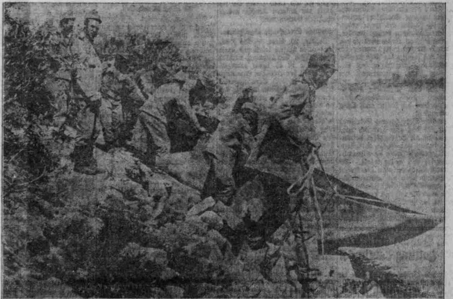
R. R. Truppen werden über den Son überschliff.