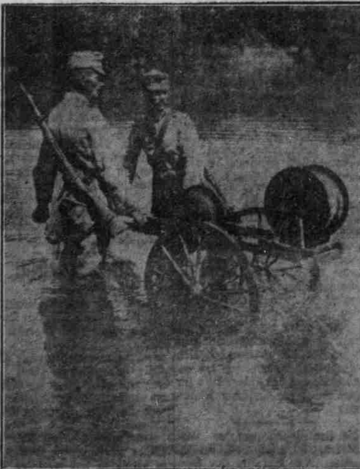
Wegen eines Kabels über den Jongo.