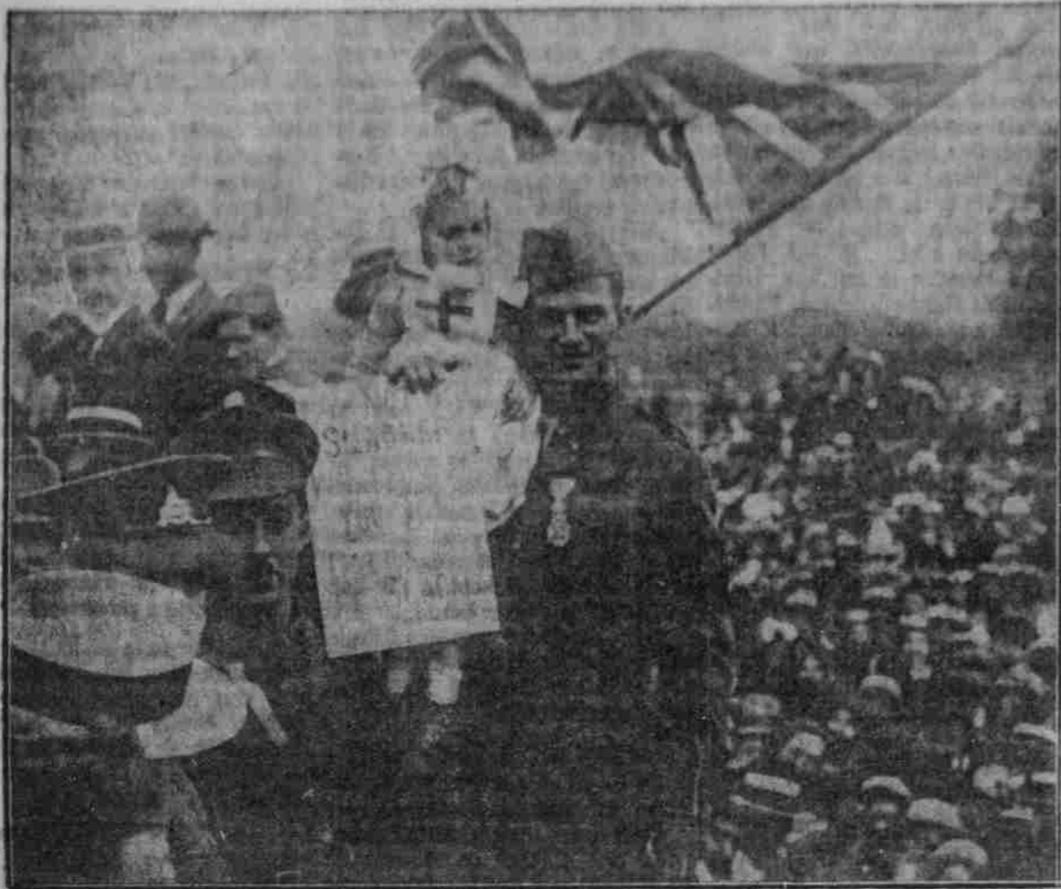
Szene in einer Werbe-Versammlung in einem Londoner Park. Das Plakat trägt die Aufschrift: „Ich bin kein Brückberger. Und Sie, mein Herr? Gott strafe die Brückberger!“