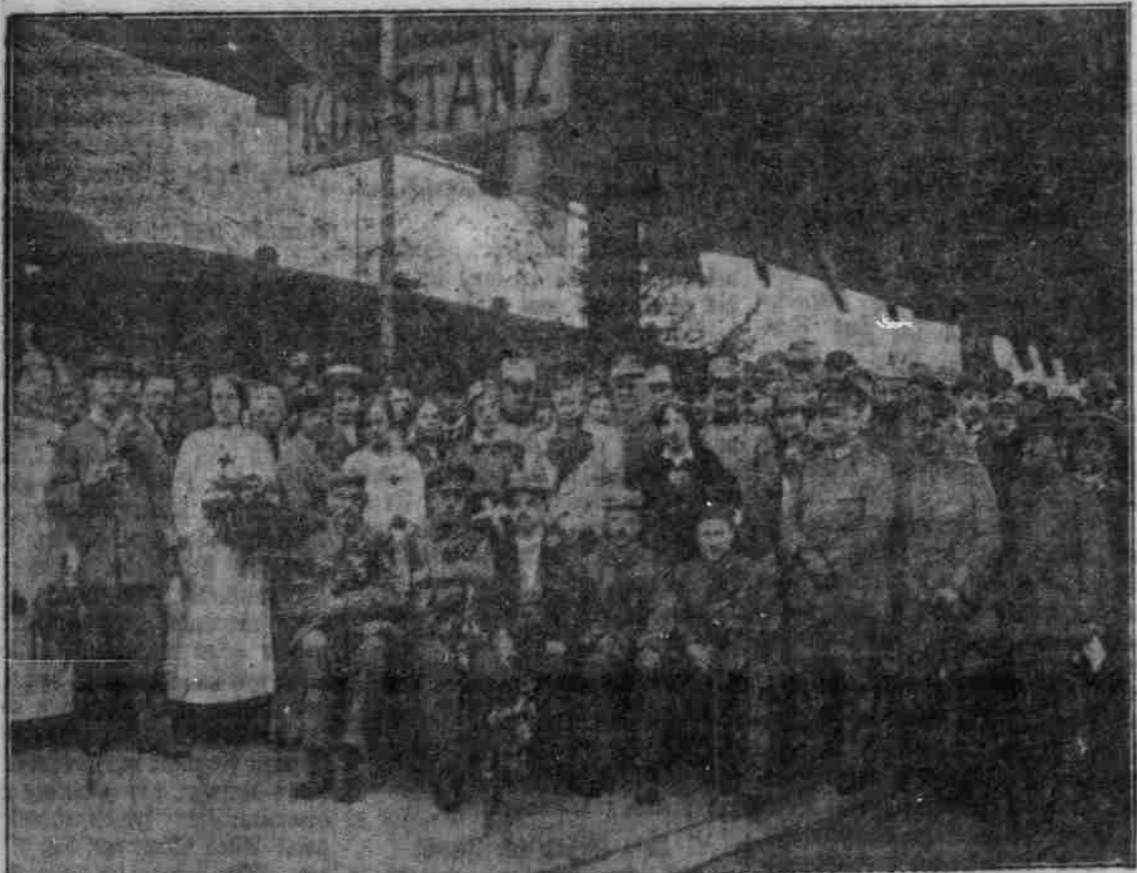
Vom zweiten Austausch deutscher und französischer Kriegsgefangener Schwerverwundeter und Sanitäter über die Schweiz; Prinz Vlag von Baden (X) mit einem Theil der Austauschkommission und der Ausgetauschten auf dem Bahnhof in Konstanz.